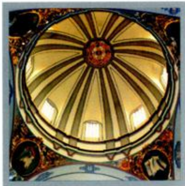
Cúpula de de la iglesia de San Antonio de Padua

Perteneció como todo el grandioso edificio de ladrillo contiguo, a un colegio de la Compañía de Jesús fundado en 1688. La iglesia edificada durante la primera mitad del siglo XVIII, es uno de los más genuinos ejemplos de la decoración rococó en Aragón, particularmente en las tribunas de madera tallada situadas sobre las capillas laterales, siguiendo el patrón jesuítico de planta de cruz latina con crucero y cúpula, con una nota regional en las tejas policromadas que cubren esta última. Solamente la portada es de piedra y en sus retablos hay esculturas de arte del taller de los Ramírez. El colegio es de gran empaque con varias plantas y armónica ordenación; encierra una suntuosa escalera cubierta por cúpula gallonada, presidida por un fresco dedicado a la exaltación del nombre de Jesús, pintado en su juventud por el insigne aragonés Francisco de Goya. Actualmente este edificio alberga la Casa de Cultura.