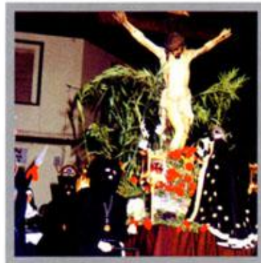
Procesión del Santo Entierro

Una de las fiestas con más arraigo entre los alagoneros es Jueves Lardero (el jueves anterior al Miércoles de Ceniza). Este día por la tarde se considera festivo y se acude al campo a degustar la tradicional "tortilla" de Jueves Lardero compuesta de chorizo y longaniza entre un pan especial llamado "torta" que solo se elabora para este día.