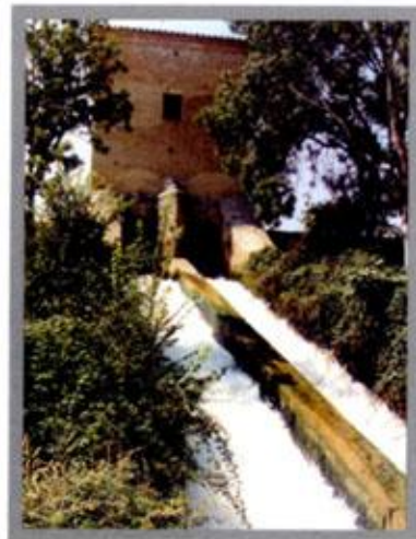
Murallas del Caracol

En las proximidades de Alagón el Canal Imperial ofrece unos parajes insólitos, sobre todo en las "murallas del Caracol", lugar donde su cauce discurre por el lecho artificial de los murallo nes levantados en el siglo XVIII, siendo considerada como una obra de gran embergadura para los tiempos en que se construyó.