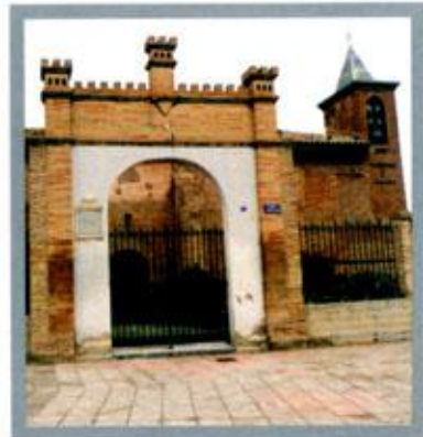
Ermita de Nuestra Señora del Castillo

Está situada en la parte más alta de la población y su toponimia nos lleva a pensar que en ese emplazamiento hubo una fortificación. Lo más antiguo que se conserva es el presbiterio que está abovedado con crucería estrellada de principios del siglo XVI. La nave consta de cinco tramos cubiertos con bóveda de lunetos. La imagen titular de la Virgen del Castillo es una talla de tradición románica que se remonta a 1300.