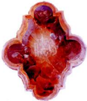
Exaltación del nombre de Jesús. Francisco de Goya