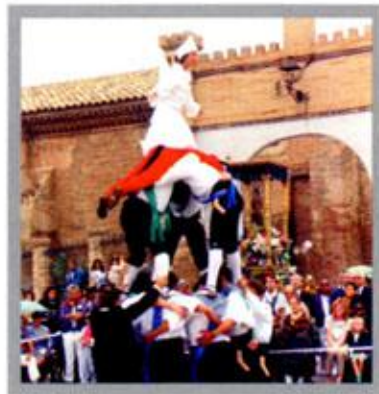
Dance de Alagón. La Torre

Alrededor del 13 de junio, Alagón celebra las fiestas de San Antonio de Padua con diversos actos religiosos, sacando al santo en procesión acompañado por el tradicional "Paloteo". Después del verano se celebra las fiestas de Nuestra Señora del Castillo, el día 8 de septiembre, que como las anterio-