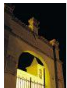
En las fotos: iglesia de los jesuitas, museo Hispano-Mexicano, detalle de la iglesia del castillo, el caracol, pinturas de Goya y vista nocturna del castillo.

Jesuitas, desde hace ya varios años Casa de Cultura. Se trata de un edificio concebido según los cánones de la arquitectura civil aragonesa de tradición mudéjar. El exterior, de ladrillo, está coronado por un mirador de arquetes en la calle Judería. En el interior, destaca la soberbia escalera cubierta por una cúpula presidida por un fresco dedicado a la exaltación del nombre de Jesús, atribuido a Goya. En las antiguas bodegas