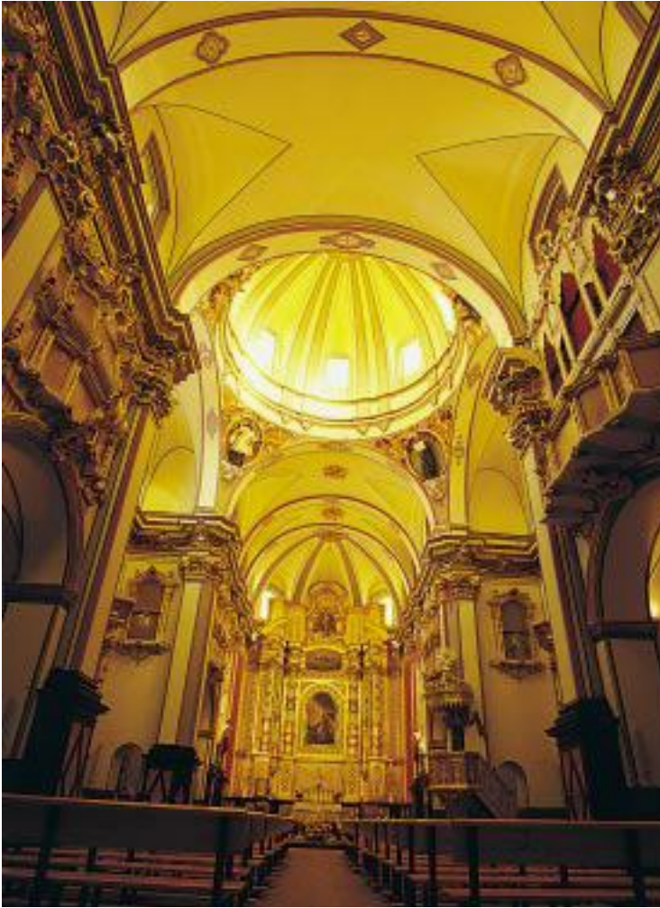
Arriba, interior de la iglesia de San Antonio y al lado vista nocturna de la localidad